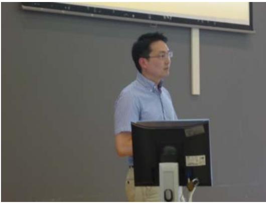
Dokter Mui Nefroloog